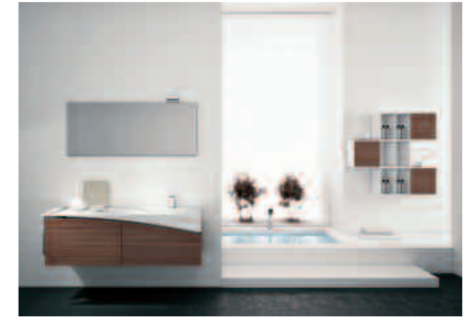
comp. 8 L.141 P.51 H.200 Cod.235 comp. 8.1 L.104 P.25 H.108 Cod.235-10