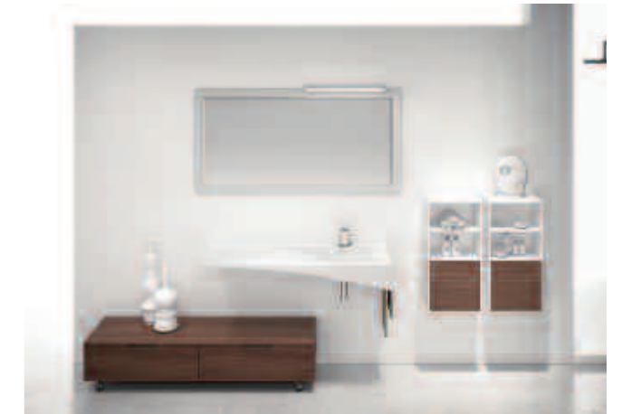
comp. 12 L.207 P.51 H.200 Cod.235 comp. 12.1 L.36+36 P.25 H.70 Cod.10+235