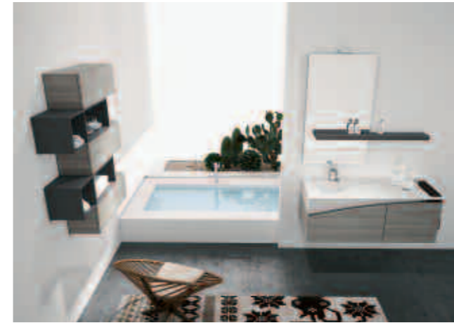
comp. 7 L.123 P.51 H.200 Cod.236-113 comp. 7.1 L.97 P.25 H.125 Cod.236-113