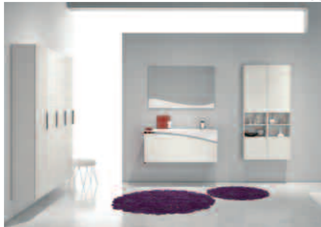
comp. 9 L.105 P.51 H.200 Cod.234 comp. 9.1 L.36+36 P.25 H.140 Cod.234-10 comp. 9.2 L.36+36+36+36 P.34 H.171 Cod.234