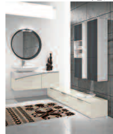
comp. 15 L.126 P.51 H.200 Cod.504-163 comp. 15.1 L.216 P.43 H.200 Cod.504-163-50