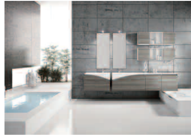
comp. 6 L.72+180 P.51 H.200 Cod.236-10 comp. 6.1 L.72+72 P.43+43 H.36 Cod.10