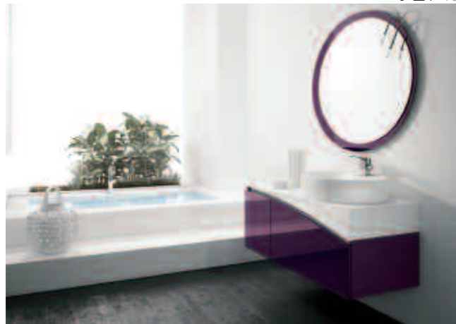
comp. 13 L.108 P.51 H.200 Cod.507