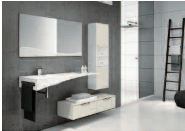
comp. 5 L.180 P.51 H.200 Cod.404-10