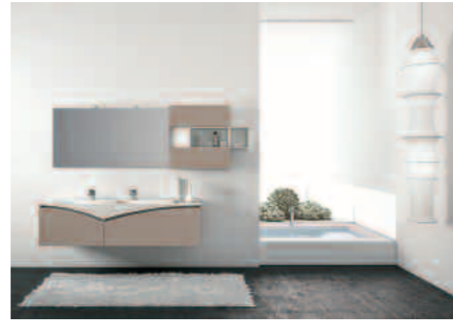
comp. 2 L.241 P.51 H.200 Cod.402+10